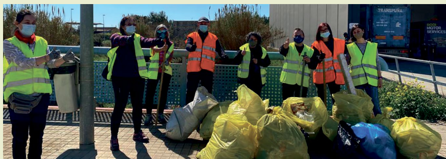
📍 Los voluntarios posan tras la recogida de basura en la naturaleza.

mejantes ni el medio ambiente. Los voluntarios se dividieron en dos grupos y limpiaron de 'basuralidad', entre otros, el Camino Natural. Sobre todo recogieron latas, botellas de bebidas y paquetes de tabaco, que han dejado personas desaprensivas que creen que la naturaleza se lo traga todo. El Ayuntamiento felicita a estos voluntarios que, a pesar del calor, acudieron a la llamada para colaborar en la limpieza del entorno natural.