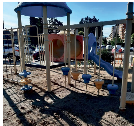
📍 Zona de juegos infantiles.

Los últimos análisis de los areneros de juegos infantiles de Binéfar, que lleva a cabo periódicamente el área de Medio Ambiente, ha dado como resultado que todos ellos están por debajo de los límites en presencia de bacterias fecales. El dato es muy positivo, pero no es motivo para prescindir de las prácticas básicas de higiene tras la utilización de los mismos.