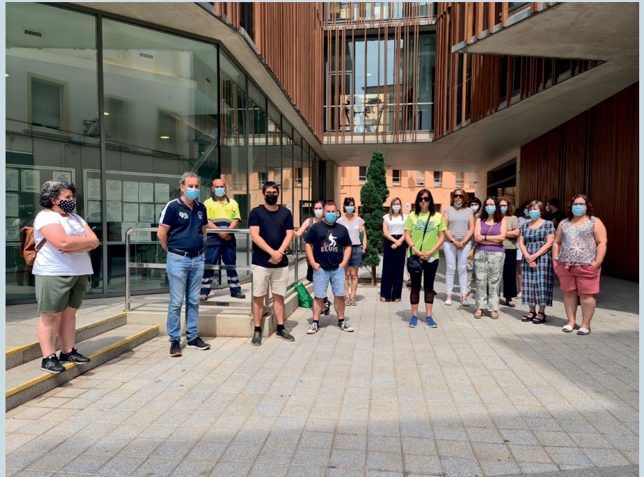
Minuto de silencio en el atrio de la Casa Consistorial.