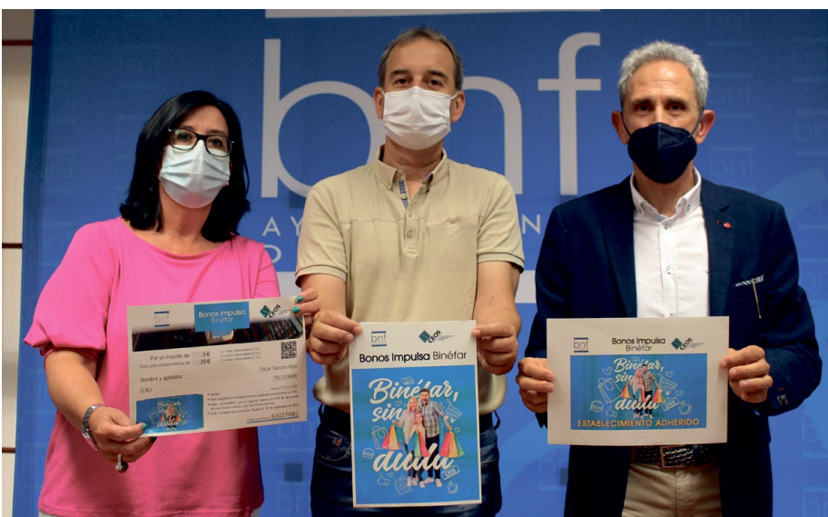
Presentación de los Bonos Impulsa Binéfar en el ayuntamiento.