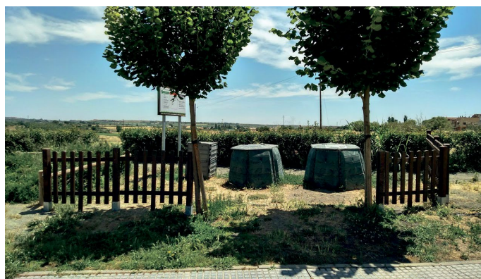
📍 Zona de compostadores.

Los interesados en colaborar en el compostaje pueden pedir información en la oficina de Medio Ambiente, personalmente o a través del correo mambiente@binefar.es , donde se les informará de las condiciones para apuntarse y de cómo proceder a compostar la materia orgánica, además de entregarles un cubo para el traslado de los residuos.