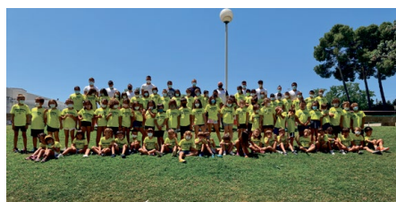
Los asistentes al segundo turno de campus deportivo posan para la foto de clausura.

que se hacen en seco, en adultos hay grupos de pilates, baile moderno zumba, entrenamiento funcional, spinbici y actividades deportivas para mayores, que suman 89 usuarios. Del total de usuarios, 322 son niños y jóvenes de ambos sexos. En los tres turnos de campus deportivos han sido 210 los usuarios y 50 usuarios por turno en los cursillos de natación.