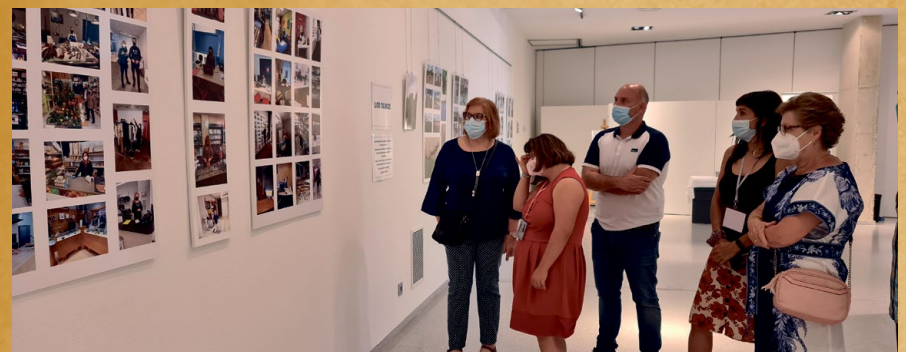
Fotografías tomadas por los usuarios del Taller Nazaret.