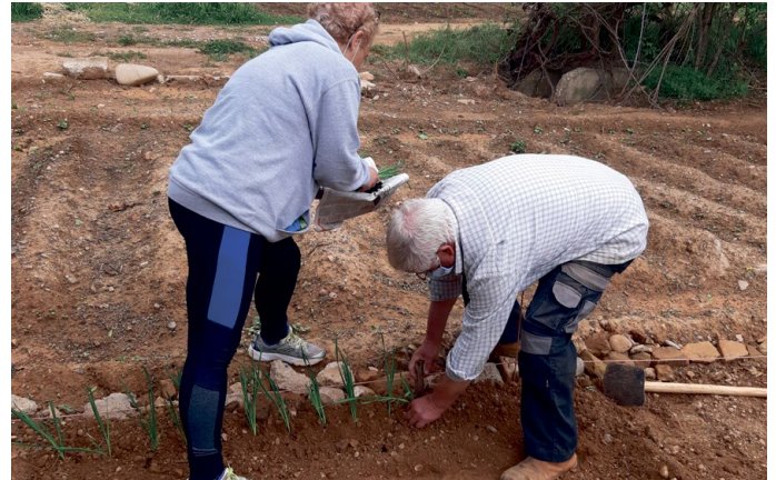
Los usuarios de huertos municipales son también los que más consultas han elevado.

Esta actividad está financiada en un 80 por ciento por la Diputación Provincial de Huesca.